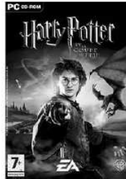
Harry Potter et la coupe de feu