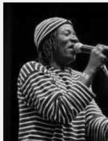
ALPHA BLONDY – reggae (à l'Olympia, le 2 novembre)

[L'examineur/l'examinatrice joue le rôle du/de la correspondant(e).]