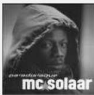
MC SOLAAR – rap (au Grand Rex, les 2 et 3 novembre)