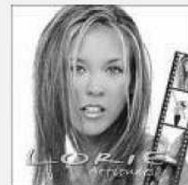
LORIE (Star Academy) – variété (au Zénith, le 6 novembre)