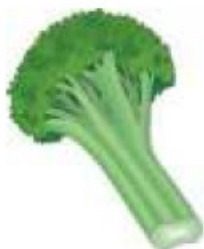
les broccoli (m)

b. Non, souvent, parce que la pizza n'est pas très bonne pour la ligne ( waistline ).