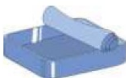
les sardines (f)

b. Non, , je suis végétarien/végétarienne.