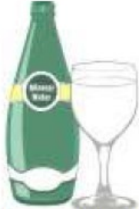
l'eau minérale (f)