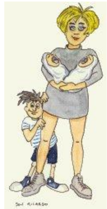
Une femme avec des enfants