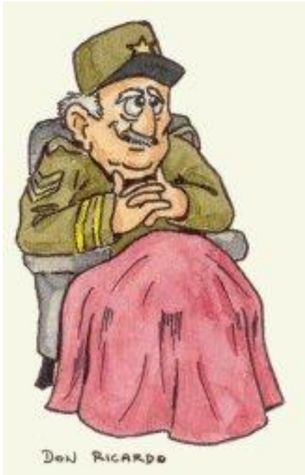
Un général à la retraite