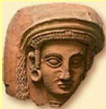
Le mystère des Phéniciens

À Paris, l'Institut du monde arabe (Ima) propose une exposition sur les Phéniciens, ce peuple mystérieux qui dominait la Méditerranée il y a 2500 ans.